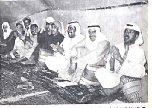
جمع اللحنين والتحنين ماهرة فكلالة بمد حوله منس الطولة وشاهه بنهم التبع راشد حمد والمهر مع الرش يسلمها المديني