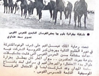
شكراة بيوغرافية يقوم بها بعض الفرسان القاديين للمهرج الموس تصوير سعد حناوي

الفرقة الوصفية يؤمنون لجانة اناء حلة السندون ويحاجهم بعض المدون تصوير سعد حناوي