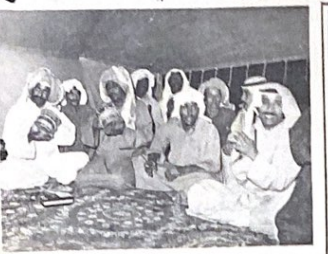
امراء العروة الوصفية يؤمنون لجانة اناء حلة السندون ويحاجهم بعض المدون