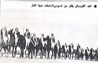
جموعه من الفرسان المشارك المهرجان لتسمرض امام المشاهدين

انصح لنا بعد مدارتنا الاولى مع الفريق السعودي ان هناك حلة مدروسة لاختصاصه بريقه لعب الفريق السعودي من الفريق الكويتي خوفا من استقلال نشاط الصلعة التي يستغلها الفريق الكويتي ولذا جاءه هذا الفريق السعودي الجديد على ان يكون اللقاء الاول لاجراء الدورة بين الكويت والسعودية حتى يتوفا فرقة بلانحة الى ضعف قد ينسب في هزيمة الفريق السعودي وسما لا شك فيه ان من حقهم اختيار الفريق الذي يبدون به الدورة بصنهم الدولة المنظمة