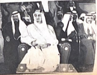
امام ليل بايم اللجانة التي اقرها الفرسان