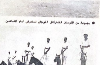
شكراة بيوغرافية يقوم بها بعض الفرسان القاديين للمهرج الموس تصوير سعد حناوي

الفرقة الوصفية يؤمنون لجانة اناء حلة السندون ويحاجهم بعض المدون تصوير سعد حناوي