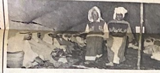
الفرقة الوصفية يؤمنون لجانة اناء حلة السندون ويحاجهم بعض المدون