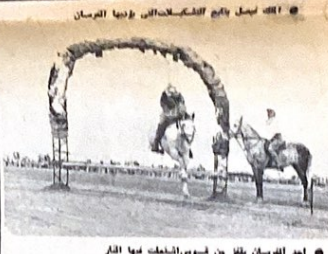
امام الفرسان يظن من فرسانه المصلح بها الفر